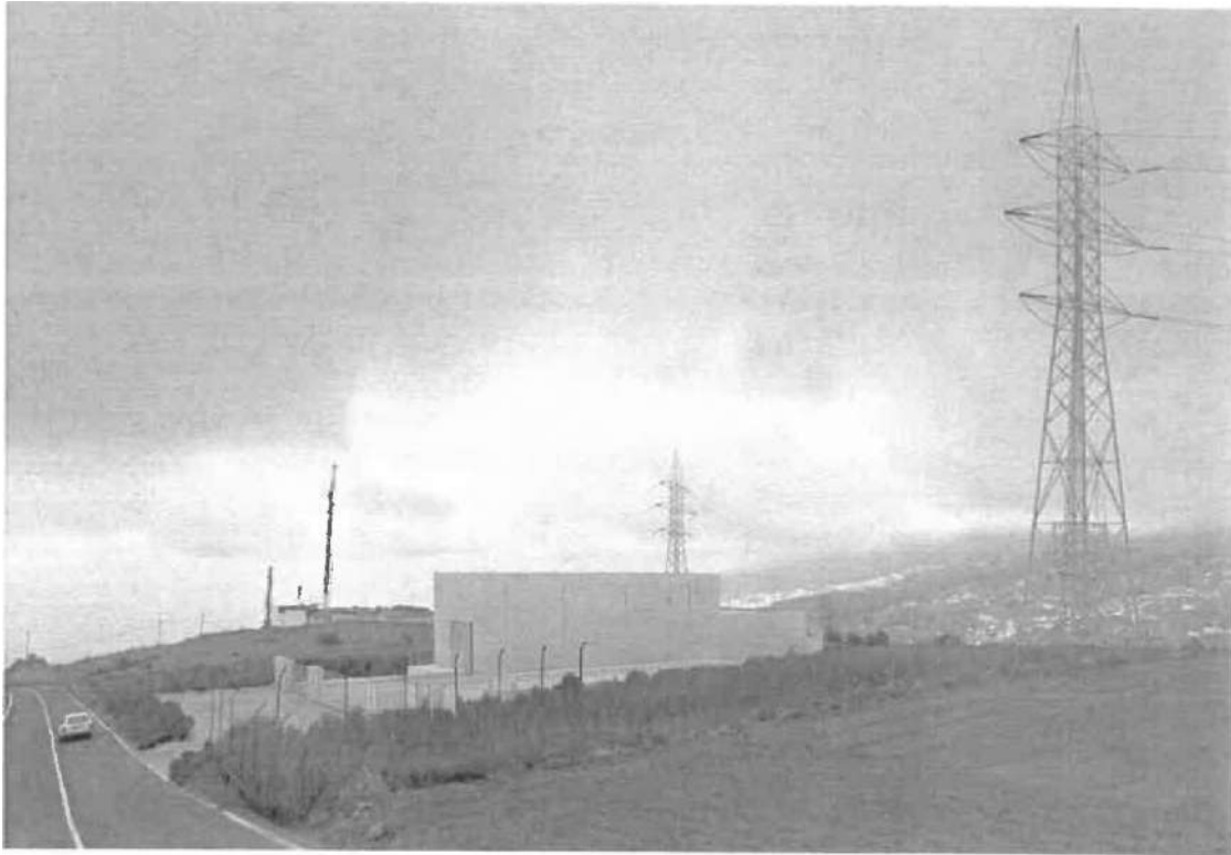
Simulación SE Drago — Versión 2: Acabado tradicional canario Icod de los Vinos Alcaldía