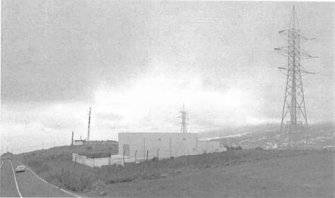
Simulación SE Drago — Versión 4: Mimetización con el entorno