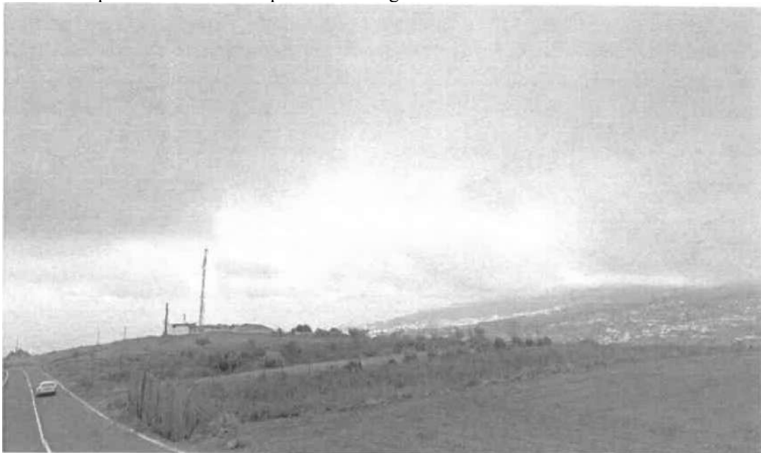
Simulación SE Drago Versión 1 : Acabados convencionales

Localización de la parcela seleccionada para la SE Drago