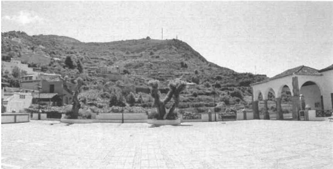
Simulación hiperrealista desde la plaza de la Iglesia de El Amparo hacia los apoyos de las L/66 kV Drago-Icod y L/66 kV Drago-L/ Los Realejos-Cuesta de la Pilla