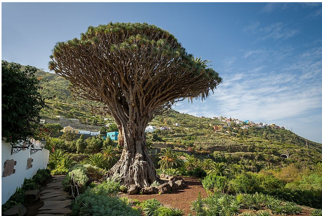
Fotografía Drago Milenario de Icod de los Vinos.

Este drago constituye el símbolo de Icod, como se puede apreciar en el escudo de armas de dicha localidad canaria. En el entorno del drago existe un parque llamado " Parque del Drago ", que exhibe distintas especies vegetales endémicas de Tenerife. También es el símbolo vegetal de la isla de Tenerife.